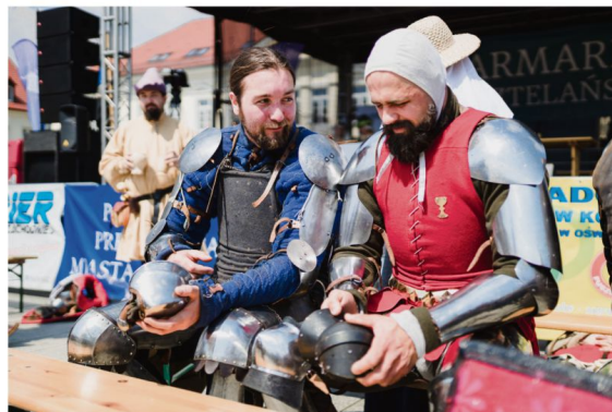
Na zdjęciu Jarmark Kasztelański w 2022 roku.

Na Rynku Głównym odbędzie się coroczny jarmark historyczny. Swoje