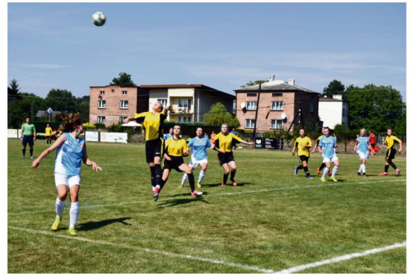
Trzy pierwsze mecze w rundzie rewanżowej nie przyniosły "Iskierkom" punktowych zdobyczy.