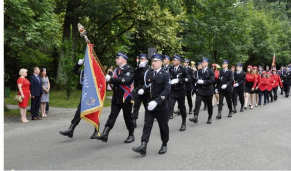
Strażacy z Grojca świętowali w 2022 roku 110-lecie. W tym roku OSP Włosienica będzie obchodzić 120 lat.