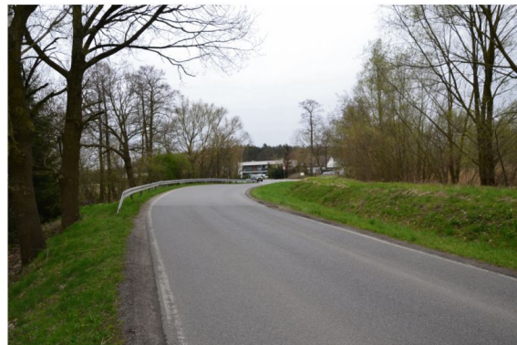
Zaborze, ulica Porębska.

We wrześniu uczestnicy zebrania wiejskiego postanowili przeznaczyć 30 tys. zł na wykonanie projektu oświetlenia odcinka ulicy Porębskiej (od skrzyżowania z obwodnicą do ul. Przedzielna). Jednak już po podjęciu tej uchwały gmina Oświęcim porozumiała się powiatem oświęcimskim w kwestii