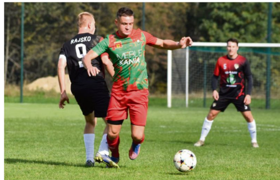
Rajsko udanie wystartowało w rundzie rewanżowej rozgrywek okręgowych.