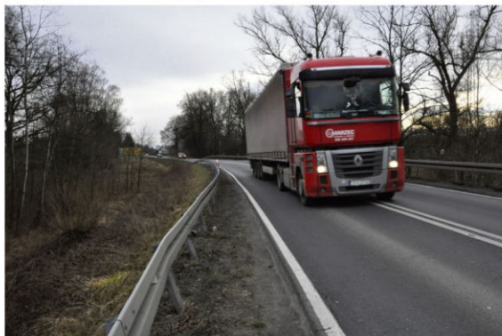
W toku są procedury poprzedzające inwestycję, na którą mieszkańcy Stawów Grojeckich czekają od lat: budowę chodnika wzdłuż prawie 300-metrowego odcinka ulicy Beskidzkiej na tzw. Zerwisku.

Odnosnie budowy chodnika wzdłuż ulicy Długiej we Włosienicy (droga krajowa) znamy na razie mniej konkretnie. Pierwszym będzie przygotowanie projektu chodnika z przejściem dla pieszych w rejonie skrzyżowań z ulicą Golcowiec i Centralną (ta osta-