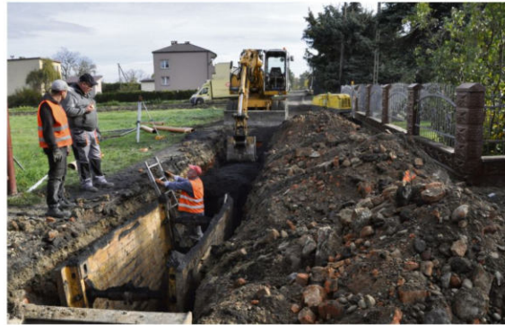
Ulica Zapłocie w Brzezince – listopad 2020.

Zadłużenie naszej gminy było i jest spłacane zgodnie z harmonogramem.