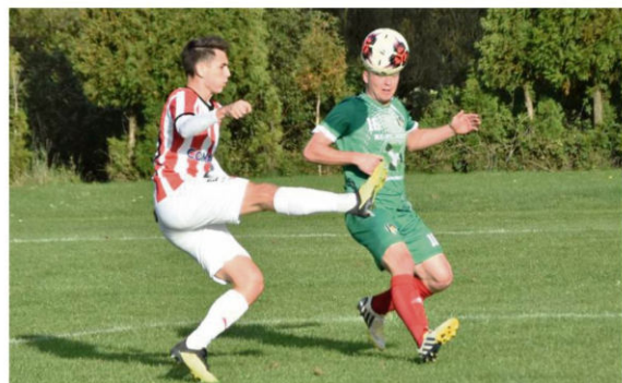
Piłkarze Rajksa rozpoczną futbolową wiosnę od pucharowego pojedynku. Ich rywalem na etapie 1/8 na szczeblu Małopolski będzie Termalica II Bruk-Bet Nieciecza.