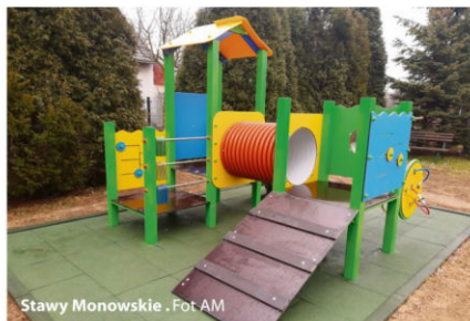
Stawy Monowskie.