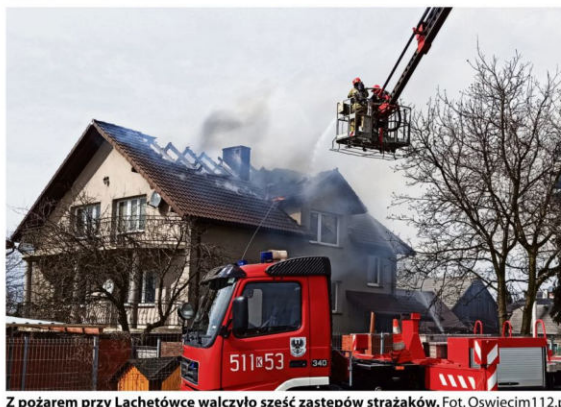
Z pożarem przy Lachetówce walczyło sześć zastępów strażaków.

Dyżurny odebrał zgłoszenie 5 kwietnia kilkanaście minut po czternastej. Prócz czterech zespołów Państwowej Straży Pożarnej na ratunek ruszyły zastępy strażaków OSP Poręba Wielka i OSP Włosienica. Ogień udało się zgasić względnie szybko, ale akcja trwała 5 godzin, bo jej częścią było również zabezpieczenie budynku. Wichura w lany poniedziałek była okropna. Rozciągnięcie plandeki w tych warunkach graniczyło z cudem.