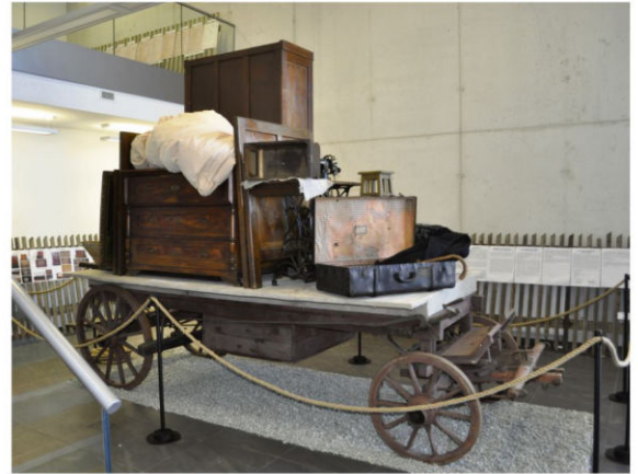
Wóz wysiedlonych – główny eksponat wystawy "Dom utracony" przygotowanej przez Fundację Pobliskie Miejsca Pamięci Auschwitz-Birkenau w 2016 roku, w 75. rocznicę wysiedleń.