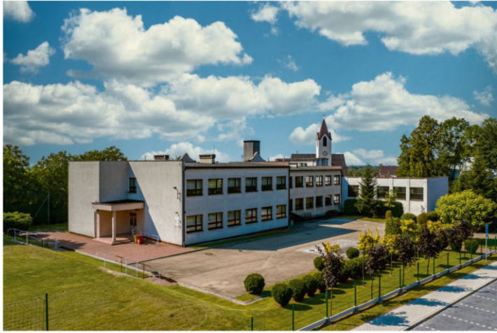
Szkoła w Grojcu – w budżecie państwa nie ma pieniędzy na jej rozbudowę.

RFIL to ponad 12 miliardów złotych, które mają pomóc samorządom w czasie pandemii. Połowa tych pieniędzy została rozdzielona latem zeszłego